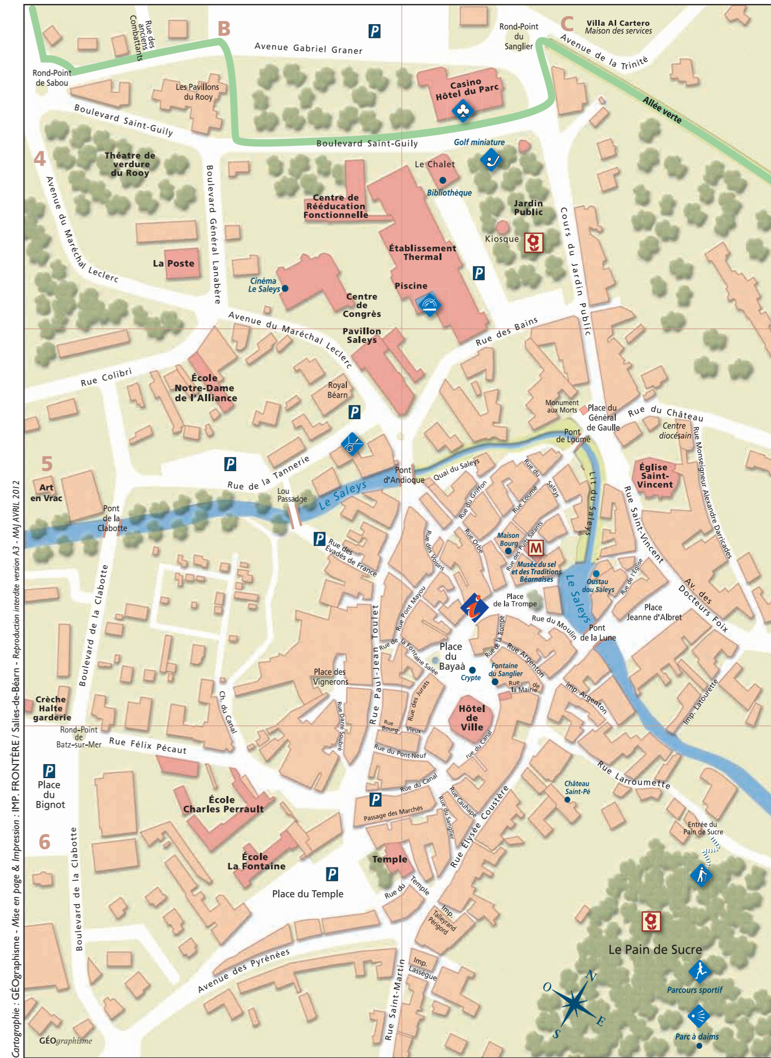
Cartographie : GÉOgraphisme - Mise en page & Impression : IMP. FRONTIÈRE / Salies-de-Béarn - Reproduction interdite version A3 - MAJ AVRIL 2012