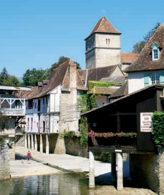
Plan de la ville