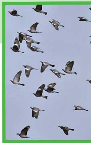
Vol de pigeons ramier

A la mi-octobre, le pigeon ramier, plus communément appelé «palombe» effectue sa migration pré-hivernale. Ce phénomène crée un véritable engouement chez les chasseurs qui investissent leur palombière préparée rigoureusement pendant des semaines. Au delà de cette activité de chasse, c'est un véritable spectacle de pouvoir observer les vols de migration et peut-être aller déguster le précieux oiseau dans les restaurants locaux.